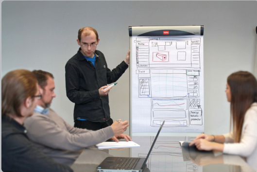
Abbildung 3: Entstehung eines visuellen Prototypen als Vorlage für einen Click-Dummy (siehe Abb. 4)